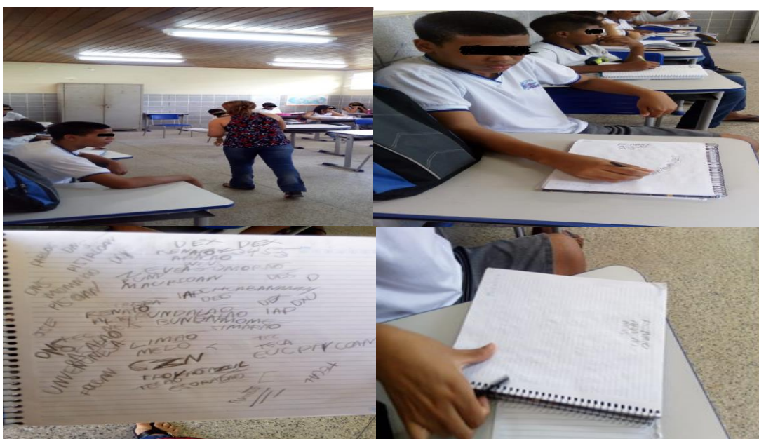
Foto 5 - Professora na sala de aula

Na hora do intervalo, ele vai junto com os outros para o refeitório, é muito descontraído e desinibido. Vive chamando as meninas de gostosa, então as professoras conversam com ele ensinando-o que em vez de dizer gostosa, dizer bonitas.